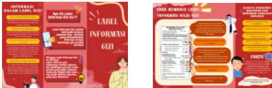
Gambar 2. Selebaran Leaflet Label ING (Informasi Nilai Gizi)

Tahap berikutnya adalah pengembangan media dengan melakukan edukasi berupa penyebaran poster dan selebaran leaflet serta mengadakan diskusi ringan kepada mahasiswa mengenai label informasi gizi. Poster melalui media sosial dengan perantara aplikasi Instagram. Pemilihan aplikasi Instagram karena aplikasi ini merupakan salah satu aplikasi dengan peminat dan pengguna yang sangat banyak, aplikasinya yang mudah digunakan serta menawarkan fitur multimedia seperti posting foto, video, dan Stories. Hal ini memungkinkan penyampaian materi dengan cara yang menarik dan interaktif, seperti melalui konten visual yang dinamis. Contoh media dapat dilihat pada gambar berikut ini.