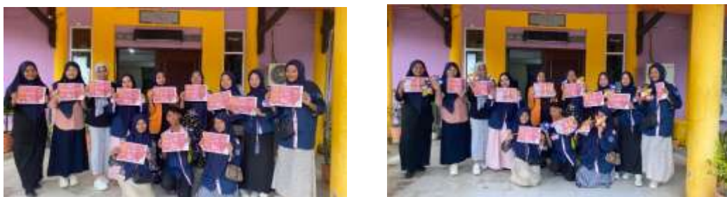
Gambar 3. Kegiatan Edukasi Membaca Label Informasi Nilai Gizi

Pada tahap implementasi program, dilakukan edukasi berupa diskusi ringan, pembahasan yang diangkat terkait informasi mengenai label nilai gizi. Pada diskusi ini, diadakan demonstrasi yang dilakukan dengan membaca label makanan kemasan serta disediakan pula selebaran leaflet yang berisi mengenai informasi nilai gizi, informasi apa saja yang tercantum dalam label gizi, cara membaca label informasi nilai gizi, dan disajikan pula informasi mengenai bahaya konsumsi makanan dan minuman kemasan berlebih beserta prevalensi kasus kesehatan akibat konsumsi makanan dan minuman kemasan yang berlebih. Selebaran leaflet ini dibagikan kepada responden yang nantinya dapat menjadi panduan dan pengingat kepada mahasiswa/i terkait perilaku baca label gizi.