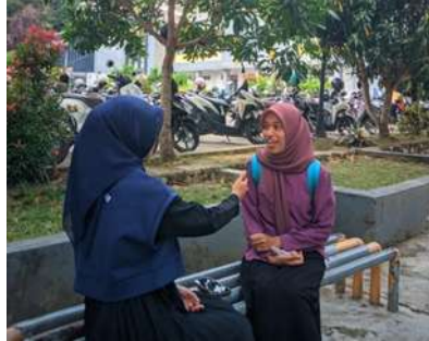
Gambar 4. Kegiatan Wawancara terhadap Salah Satu Responden

paham akan penggunaan label informasi gizi, yang sebelumnya dia sering mengabaikan label ING, tetapi sekarang dia lebih menyadari pentingnya data yang diberikan dalam label informasi nilai gizi, dan menjadi lebih selektif dalam memilih makanan dan minuman kemasan yang akan dikonsumsi.