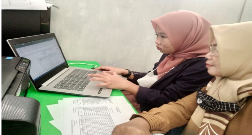
Gambar 10. Membantu administrasi sekolah