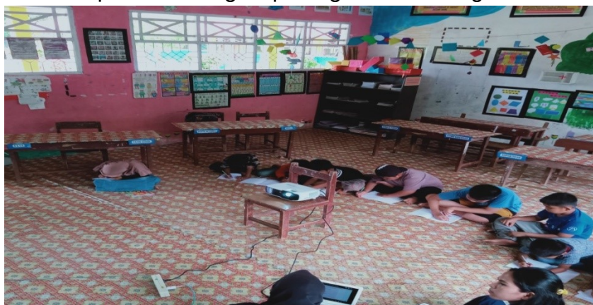
Gambar 9. Penguatan literasi numerasi murid menggunakan layar LCD

Dalam adaptasi teknologi kali ini pemanfaatan media pembelajaran berupa video pembelajaran telah dilaksanakan dengan memberikan video take mandiri berisi penjelasan terkait. Materi atau menggunakan video yang diberikan relevan dengan materi yang dibahas. Terutama dalam meningkatkan literasi dan numerasi siswa. Hal ini membuat para murid merasa antusias dan tertarik serta mendapatkan pengalaman pembelajaran yang baru.