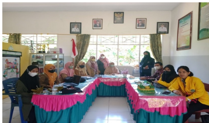
Gambar 4. Diskusi bersama terkait program literasi dan numerasi

Pengabdian kepada masyarakat (PKM) yang dilakukan oleh mahasiswa dan tim Kampus Mengajar 3 serta siswa di SD Negeri 354 Lando Aje Kabupaten Luwu. Kegiatan pengabdian masyarakat ini, diawali dengan menyampaikan program kegiatan pembiasaan literasi dan numerasi yang akan dilaksanakan di SD Negeri 354 Landoa Aje Kabupaten Luwu. Kemudian mendengarkan penyampaian dan arahan dari kepala sekolah, terkait peserta didik dikelas 1 dan kelas 3 informasi dari kepala sekolah beberapa murid yang tidak tahu membaca, bahkan ada sampai tidak mengenal huruf dan untuk itu perlunya kegiatan pendampingan secara khusus. Pertemuan hari ini dilanjut dengan berdiskusi dengan guru-guru tentang pelaksanaan kegiatan literasi dan numerasi, mahasiswa Kampus Mengajar 3 guna untuk menghidupkan kegiatan literasi numerasi di SD Negeri 354 Lando Aje Kabupetn Luwu.