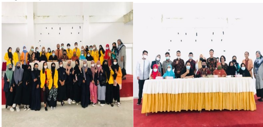
Gambar 3. Koordinasi dengan Dinas Pendidikan Kabupaten Luwu

sekolah, saya sendiri ditugaskan di SD Negeri 354 Lando Aje yang berada di Kabupaten Luwu, dengan mahasiswa sebanyak 4 orang yang semuanya hadir dalam kegiatan penerimaan.