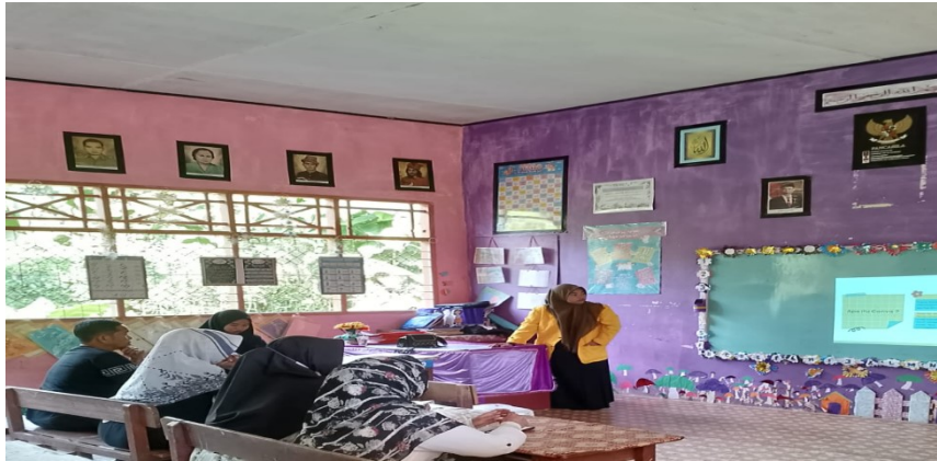
Gambar 7. Mengajar dikelas 2 Pengutan literasi murid

Selain pembelajaran disekolah mahasiswa dan tim juga membuat kelas senja atau pembelajaran luar kelas (ekstrakurikuler) disore hari karena ini dianggap memiliki capaian pembelajaran, khususnya capaian kemampuan literasi baca tulis, dan untuk menumbuhkan budi pekerti melalui pembelajaran yang menyenangkan dan ramah kepada peserta didik, sehingga menumbuhkan semangat dalam kegiatan literasi baca tulis, menumbuhkan semangat ingin tahu dan cinta pengetahuan, dan memampukan setiap anak untuk terlatih berkomunikasi dan dapat bersosialisasi di lingkungannya. proses pembelajaran kelas 3 yang diberikan mahasiswa adalah materi tematik (matematika), memberikan pembelajaran disore hari dalam peningkatan literasi numarasi.