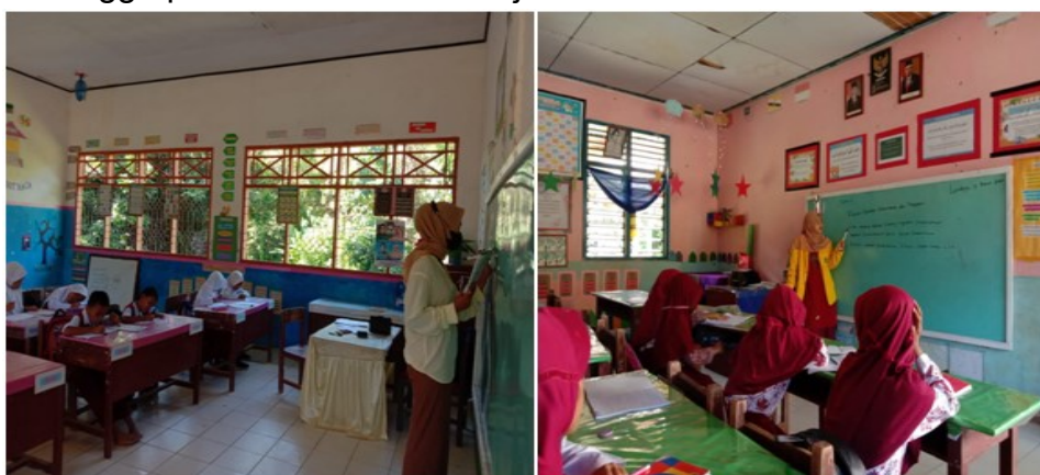
Gambar 5. Kegiatan Mengajar

Mengajar dan membimbing murid sekolah SDN 354 Landoaje dari kelas 1-6, karena masih ada beberapa murid yang butuh bimbingan khusus seperti membaca dan perhitungan. Serta membimbing murid mengajarkan tentang literasi, numerasi. Kegiatan pembelajaran di SD Negeri 354 Landoaje dilakukan secara bergantian yang dimana disesuaikan dengan hari dalam seminggu. Hari senin, rabu, jumat siswa yang datang yaitu kelas 1,3,5 dan hari selasa, kamis, sabtu maka siswa yang datang yaitu kelas 2, 4, dan 6. Dalam pelaksanaannya, mahasiswa mengajar murid dengan menggunakan buku tematik terpadu kurikulum 2013 yang sesuai dengan pembelajaran yang mereka pelajari. Mulai dari pembelajaran literasi, numerasi hingga pemberian modul belajar.