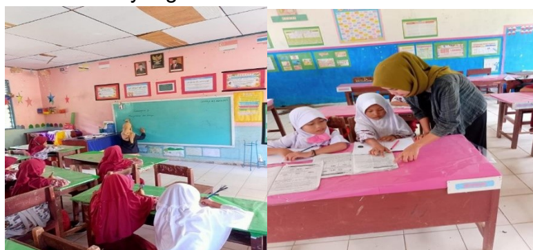
Gambar 6. Membantu murid dalam penguatan literasi

Dalam pelaksanaan proses belajar mengajar, mahasiswa tidak diberikan kelas secara langsung tetapi berkolaborasi dengan guru kelas. Mahasiswa mengajar menggunakan buku tematik terpadu kurikulum 2013 sesuai dengan pembelajaran siswa di hari itu. Selain itu, juga memberikan modul belajar kepada kelas 1 dan 2 sebagai penguatan literasi numerasi, mengajar dengan menggunakan bantuan layar LCD yang materinya telah dibuat dalam bentuk video. Kegiatan hari ini di SD Negeri 354 Lando Aje mahasiswa memulai proses pembelajaran di kelas dua, dengan membawakan materi tematik, serta menjelaskan materi tersebut, dan mengajar siswa membaca yang belum tahu membaca selama 120 menit.