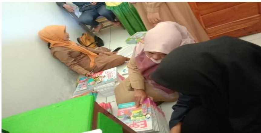
Gambar 11. Kegiatan administrasi perpustakaan

Mengenai bantuan administrasi, mahasiswa melihat bahwa ada pembenahan ekstra pada perpustakaan di SD Negeri 354 Lando Aje Kabupaten Luwu, yakni meliputi penataan ulang perpustakaan dan juga penomoran buku. Hal ini disesuaikan dengan permintaan para guru, yang mana memang administrasi terkait perpustakaan perlu dirombak, kurang tertata rapi dan masih kekurangan banyak buku. Alhasil, tidak heran jika jarang ada siswa yang mampir membaca buku disana.