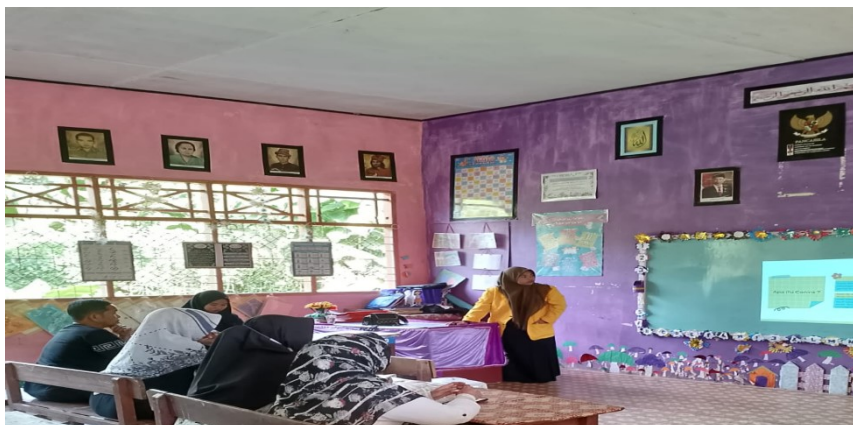
Gambar 8. Adaptasi teknologi kepada guru di SD Negeri 354 Lando Aje